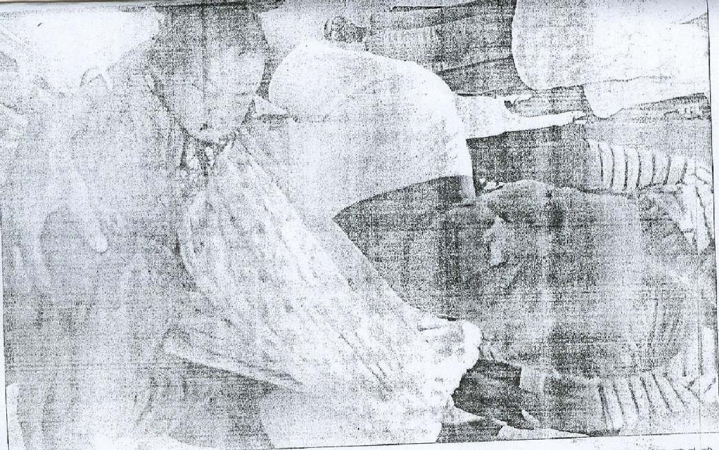
শিল্প-সংক্রান্ত কাজে স্নাতক-শ্রেণীর চ্যাম্পিয়ন কাটতে গিয়ে প্যেঞ্জালের আঙুল কাটলেন নাসি।